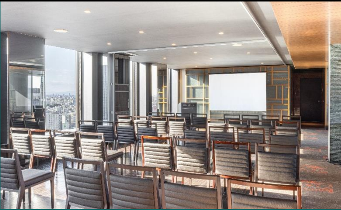
スクールイメージ